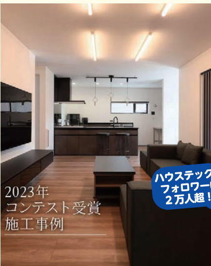
2023年 コンテスト受賞 施工事例

ご応募いただいた作品の中から ハウステック公式ホームページやInstagramへ掲載をします！