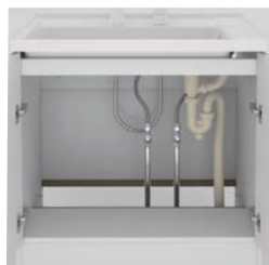
※画像は説明のため点検フタを取り外しています。

洗面台は当社従来品(陶器製)に比べて約40%軽くなりました。間口60cmで約23kg、75cmで約26kg(梱包時)です。さらに底板点検口付きのため、リフォーム配管もしやすくなっています。